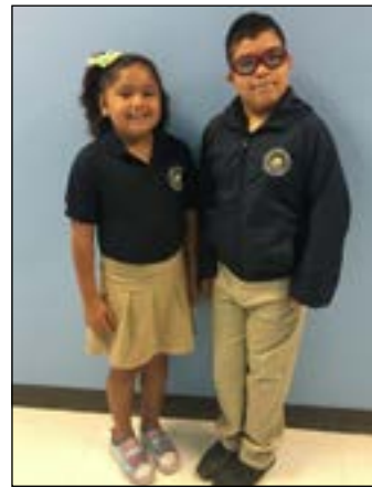
1st - 4th