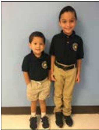
PK3 - Kinder