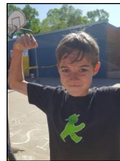
¡Nove mostrando su espíritu escolar!

★ ¡No es demasiado tarde! ¡Puede hacer una donación caritativa deducible de impuestos para 2018 al PTO de Wildcats! Haga los cheques a nombre de Wildcats PTO y déjelos o envíelos a: Needham Elementary School 2425 W 3rd Ave, Durango, CO 81301