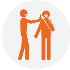
与人的密切接触，如触摸和握手