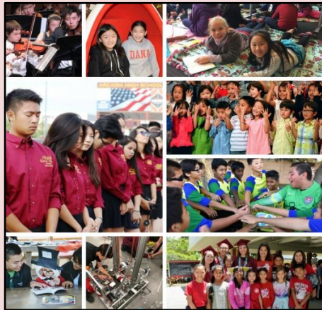
所服务社区：阿卡迪亚